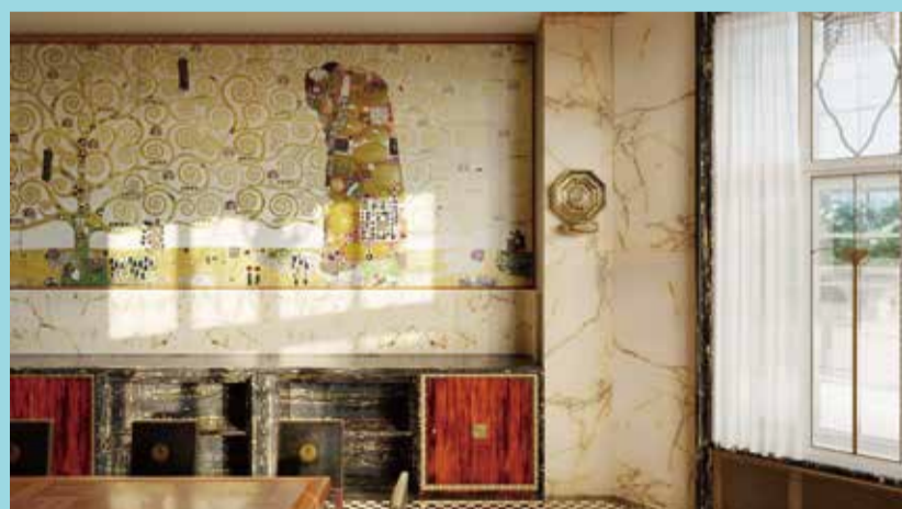
ヨーゼフ・ホフマン設計によるストックレー邸の3D復元 - AIIce ラボ(ブリュッセル自由大学[ULB]) & Urban.brussels、2024年

講演は英語で行われますが、同時翻訳しますので、英語が苦手な方も気軽にご参加ください。