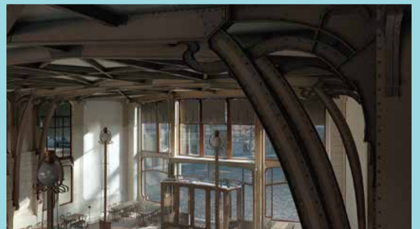
3D Restitution Hypothesis of Victor Horta's Maison du Peuple – AllCe lab (ULB) & Horta Museum, 2019.

The lecture will be in English with simultaneous Japanese interpretation.