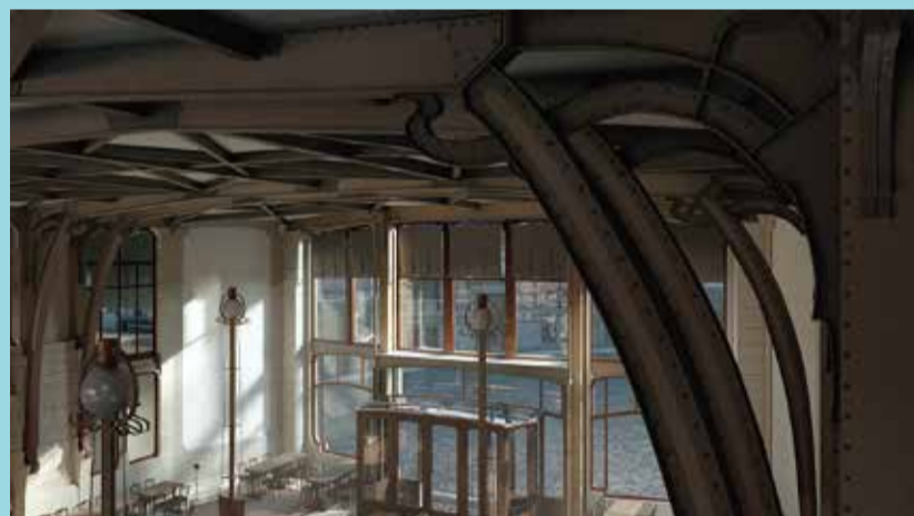
ヴィクトル・オルタ設計による人民の家(メゾン・デュ・プーブル)の3D復元 - AIIce ラボ(ブリュッセル自由大学[ULB]) & オルタ美術館、2019年