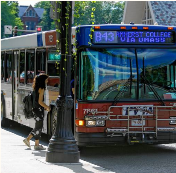
PVTA、ファイブ・カレッジのバスライン