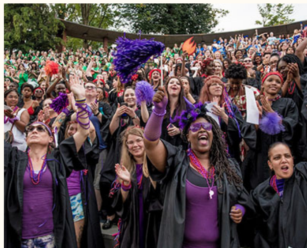
コンボケーションの時のFP学生

*FPとはフランシス・パーキンス (有名なマウントホリヨーク卒者) の略語です。