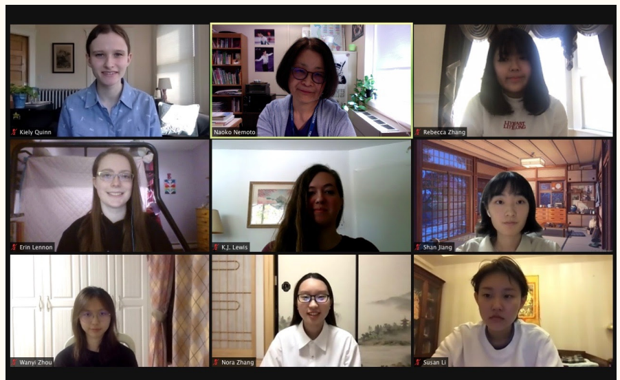
ズームで授業 (2021年春学期日本語3年生)

これらの違いは学生の生活に影響を与えました。例えば、キャンパスは閉まっていたので、コミュニティーとつながるのは難しかったです。寂しい思いをしていた人も少なくなかったでしょう。その上、マウントホリヨークの伝統行事が出来ませんでした。マウントホリヨークは色々な伝統があるのですが、例えばマウンテンデーやリングとバラ (Rings & Roses) という伝統が今年出来ませんでした。私はこれらの伝統が恋しいです。そして、入学のオリエンテーションと卒業式はオンラインで、残念でした。(オリエンテーションは一週間で大学の一年生がキャンパスに紹介されることです。) 私たちにとって、コロナウイルスの影響は、本当に大きかったです。