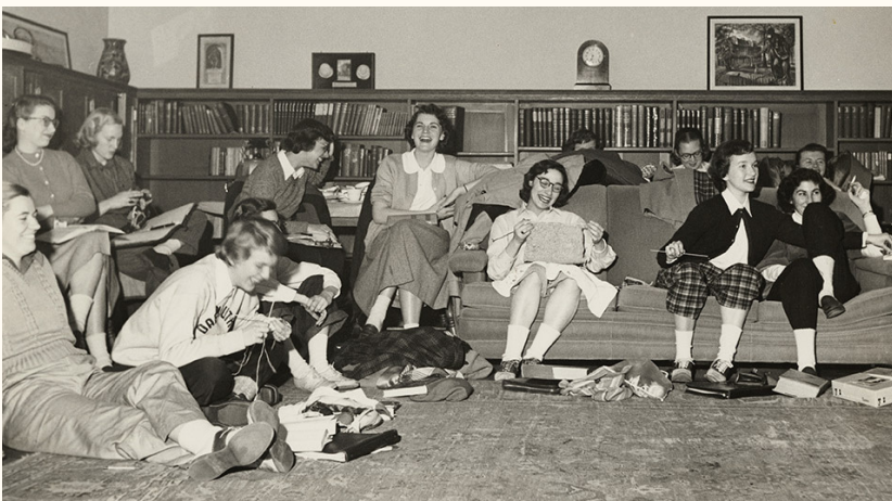
1949年文芸批評セミナー