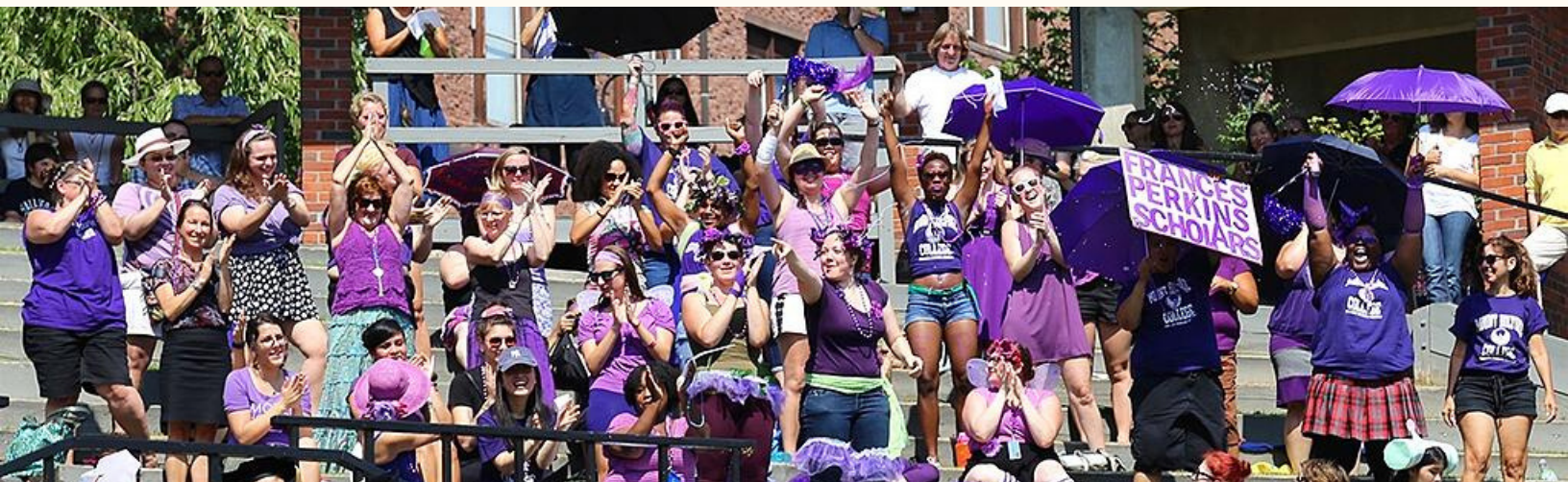
コンボケーションの時のFP学生