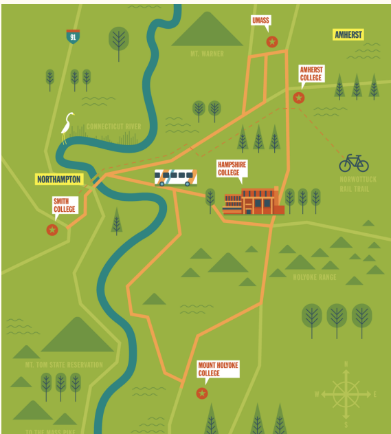
ファイブ・カレッジの地図